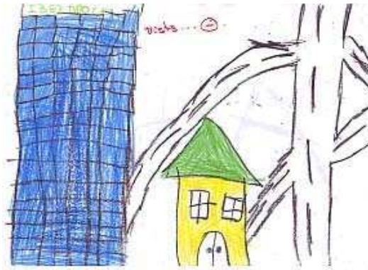
Alumnado que reside en el entorno urbano