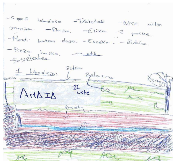
Alumnado que reside en el entorno rural

Fuente: GOBIERNO VASCO. Aproximación a las necesidades y demandas de la infancia y la adolescencia en la CAPV. 2010